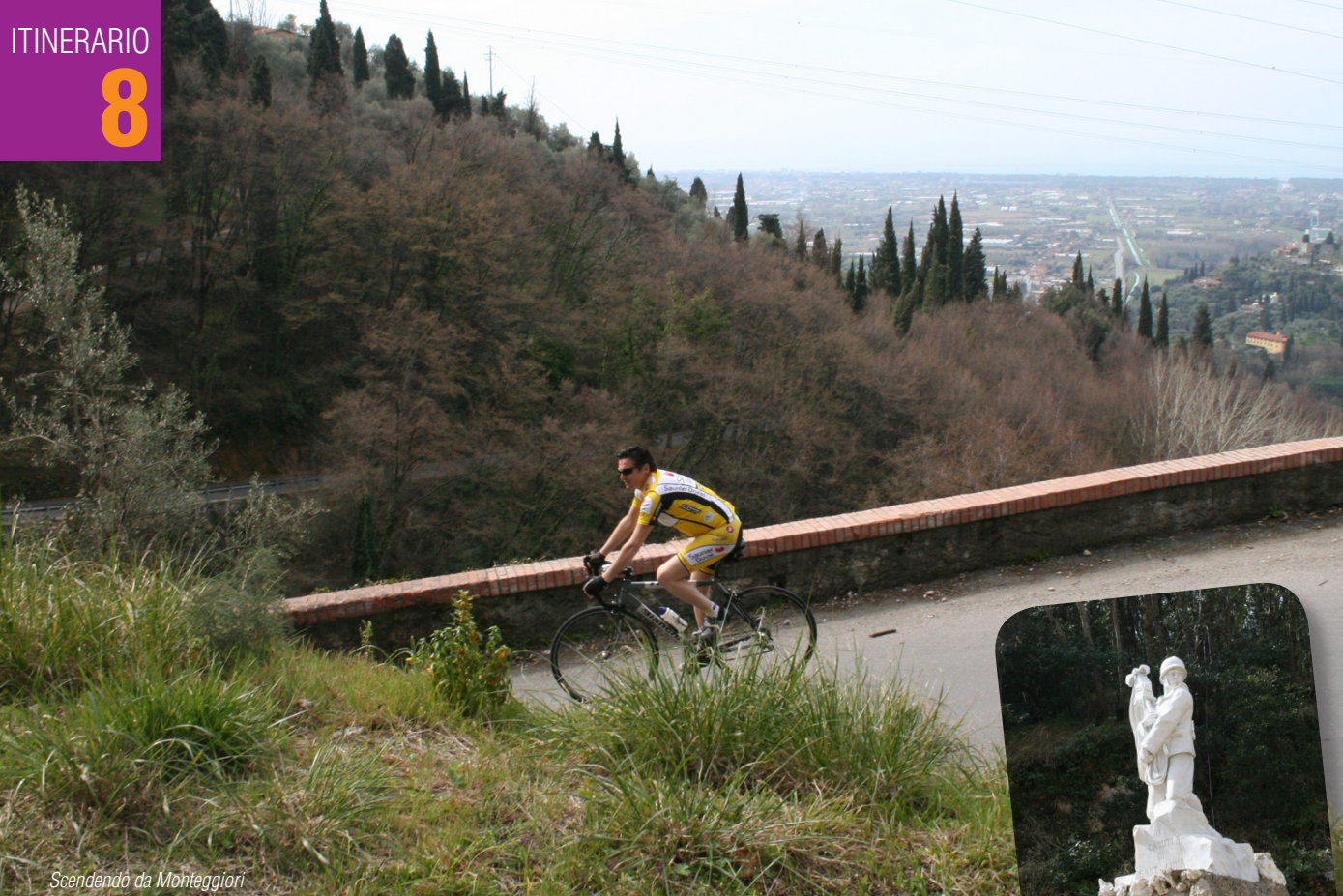
Scendendo da Monteggiari

una sosta se non altro per il bel panorama. Purtroppo qui la strada termina e quindi torneremo indietro, proseguendo poi a destra. Fatti 300 metri svoltiamo a sinistra seguendo per Sant'Anna di Stazzema