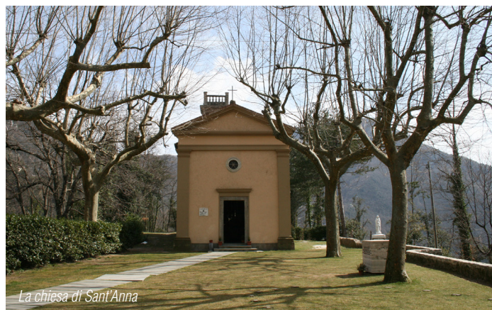
La chiesa di Sant'Anna

che raggiungeremo dopo 6,5 km. Anche in questo tratto la salita è tosta fino alla frazione La Culla ma il panorama sulla piana di Camaiore (e oltre) merita tutte le gocce di sudore. Da qui troviamo un tratto