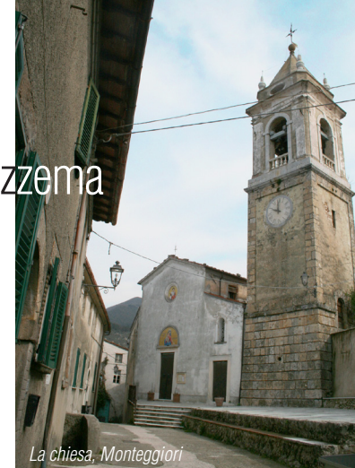
La chiesa, Monteggiori

Partendo dal lungomare di Viareggio di fronte al Caffè Galliano ci dirigiamo verso Camaione percorrendo la via Marco Polo fino alla prima rotonda dove svoltiamo a sinistra imboccando la via Aurelia. Dopo circa 1 km alla terza rotonda che incontriamo svoltiamo a destra in via Italice che percorriamo tutta fino al semaforo dove svolteremo a sinistra in direzione di Pietrasanta.