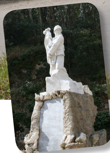
Monumentio ai caduti, Sant'Anna di Stazzema

in discesa e poi ancora una salita lungo il costone del Monte Gabberi fino alla Chiesa di Sant'Anna, dove il 12 agosto 1944 la barbarie umana ha toccato uno dei suoi abissi più profondi.