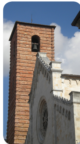
Il Duomo, Pietrasanta

Essendo un circuito ad anello possiamo seguirlo anche nel senso inverso, tenendo presente che la salita da Pietrasanta verso Capriglia è più agevole anche se leggermente più lunga, mentre la salita di Monteggiori è adatta soltanto a chi ha un discreto grado di forma.