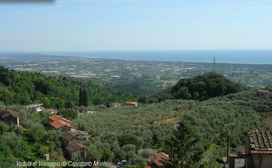
Veduta di Viareggio da Capezzano Monte

salita abbastanza impegnativa che vi porterà fino a Monteggiori. La discesa verso Capezzano Pianore è breve, ma richiede ottimi freni. Giunti in fondo alla discesa troveremo una rotonda e svolteremo a destra in direzione di Pietrasanta e incontriamo la località Baccatoio con un piccolo tratto in salita di cir-