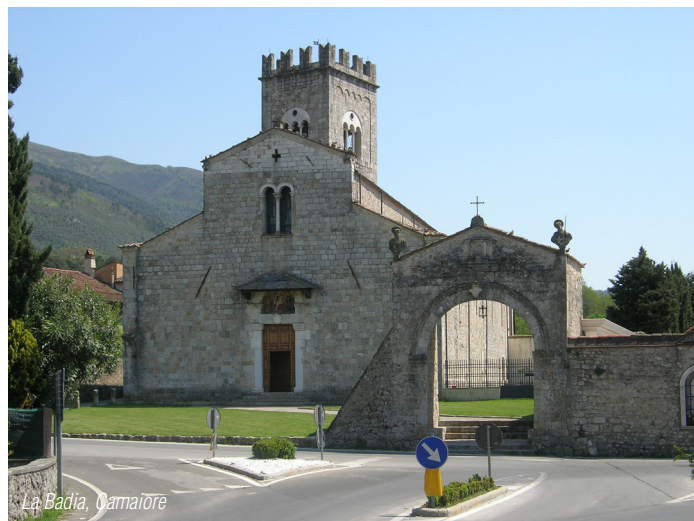
La Badia, Camaiore

ca 300 metri. Superato il bivio per Valdicastello (famosa per aver dato i natali a Giosuè Carducci e dove è possibile visitare il museo a lui dedicato), sulla destra ecco una piccola strada con l'indicazione per Capezzano Monte (attenzione l'indicazione si legge solo proveniendo da Pietrasanta). La salita inizia