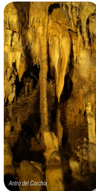
Antro del Corchia

zioni per Castelnuovo ed iniziamo la salita vera e propria. La salita ha una pendenza costante e non ardua ma richiede un discreto allenamento e una buona forma fisica. Dopo 3,1 km dal bivio troviamo Retignano, altri 3,6 km e giungiamo a Levigliani famosa per l'antro del Corchia, una grotta naturale visitabile tutto l'anno (info 0584.778405 - www.antrocorchia.it ). Dopo 2,3 km raggiungiamo il bivio per Terrinca e fatti altri 300 metri svoltiamo a destra seguendo l'indicazione per Passo Croce. Da questo punto ci aspettano 6,2 km di una salita a tratti molto ripida e faticosa, ma l'arrivo nello spiazzo dove termina la strada asfaltata ci ripaga di tutto il nostro sudore regalandoci dei panorami incantevoli sul Monte Corchia, sull'Alta Versilia e il mare. Seguendo lo stesso itinerario torniamo al punto di partenza della nostra escursione.