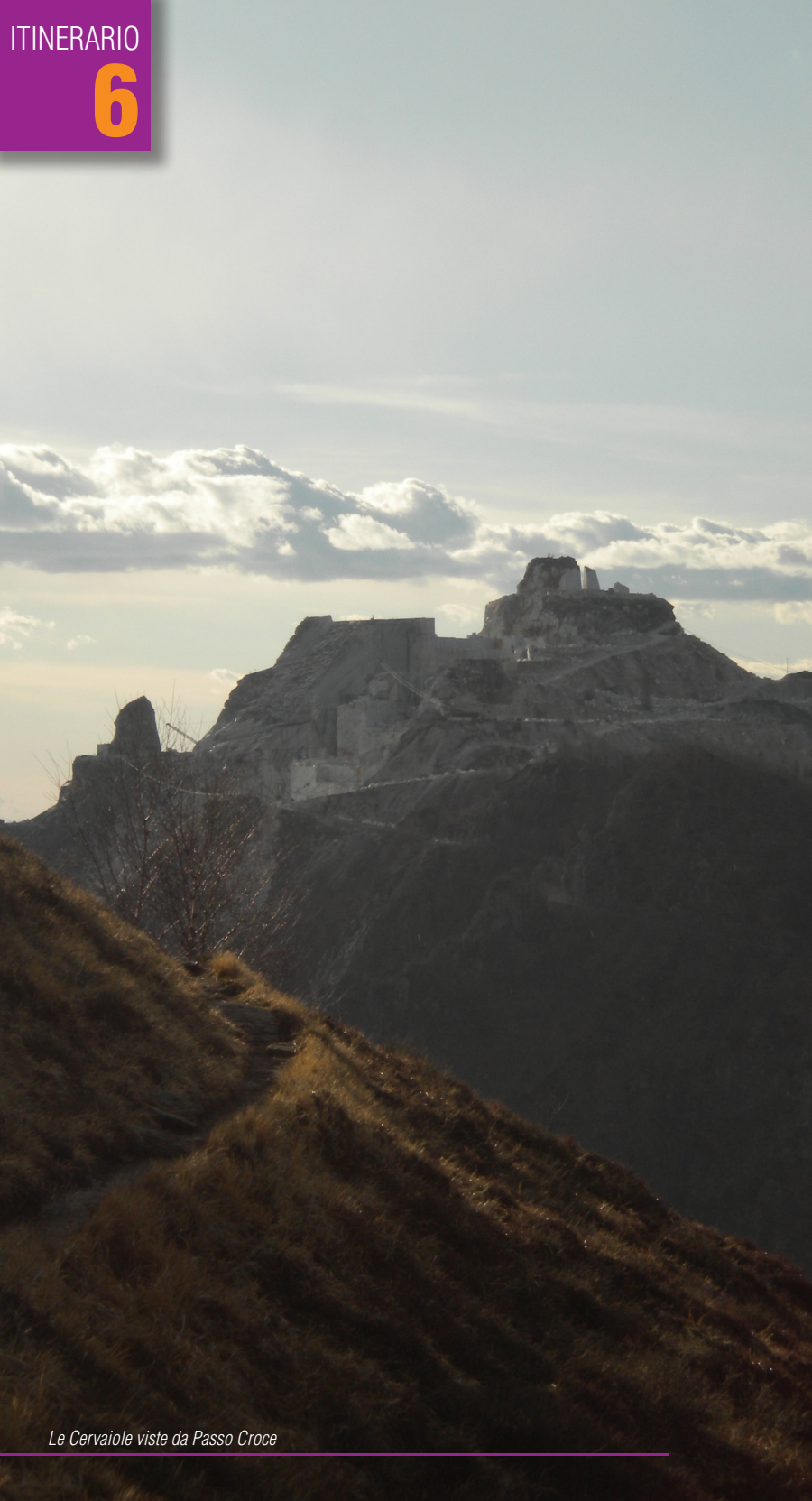
Le Cervaiole viste da Passo Croce

zioni per Castelnuovo ed iniziamo la salita vera e propria. La salita ha una pendenza costante e non ardua ma richiede un discreto allenamento e una buona forma fisica. Dopo 3,1 km dal bivio troviamo Retignano, altri 3,6 km e giungiamo a Levigliani famosa per l'antro del Corchia, una grotta naturale visitabile tutto l'anno (info 0584.778405 - www.antrocorchia.it ). Dopo 2,3 km raggiungiamo il bivio per Terrinca e fatti altri 300 metri svoltiamo a destra seguendo l'indicazione per Passo Croce. Da questo punto ci aspettano 6,2 km di una salita a tratti molto ripida e faticosa, ma l'arrivo nello spiazzo dove termina la strada asfaltata ci ripaga di tutto il nostro sudore regalandoci dei panorami incantevoli sul Monte Corchia, sull'Alta Versilia e il mare. Seguendo lo stesso itinerario torniamo al punto di partenza della nostra escursione.