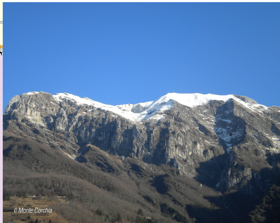
Il Monte Corchia