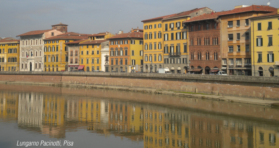
Lungarno Pacinotti, Pisa

ro e ancora proseguiamo dritto per il lago che raggiungeremo dopo 1 km. Una volta raggiunta l'isola pedonale possiamo riposarci ammirando il bellissimo panorama, oppure visitando la casa di Gia-