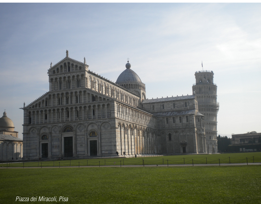
Piazza dei Miracoli, Pisa

como Puccini. Nel periodo estivo, nel teatro all'aperto realizzato sulle sponde del lago si svolge il Festival Pucciniano, con la rappresentazione delle opere liriche del Maestro. Percorrendo la stessa strada ritor-