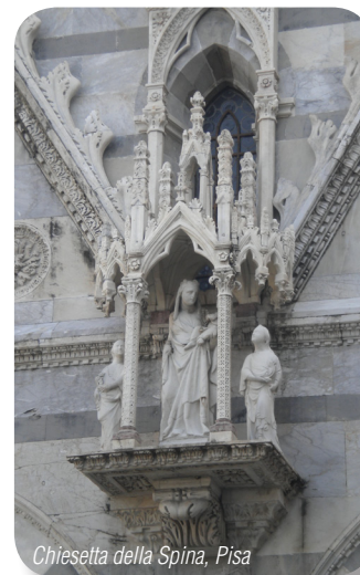
Chiesetta della Spina, Pisa

niamo alla piazza principale dove svoltando a sinistra seguiremo l'indicazione per Pisa percorrendo la via Aurelia. Dopo 9 km raggiungeremo Migliarino e dopo altri 4 arriveremo a Pisa. Dopo il semaforo vicino ad un Mac Donald's svoltiamo a sinistra seguendo le indicazioni per la Torre. Dopo circa due km la Piazza dei Miracoli vi si offrirà in tutto il suo splendore. Ancora attraverso la via Aurelia torneremo al nostro punto di partenza.