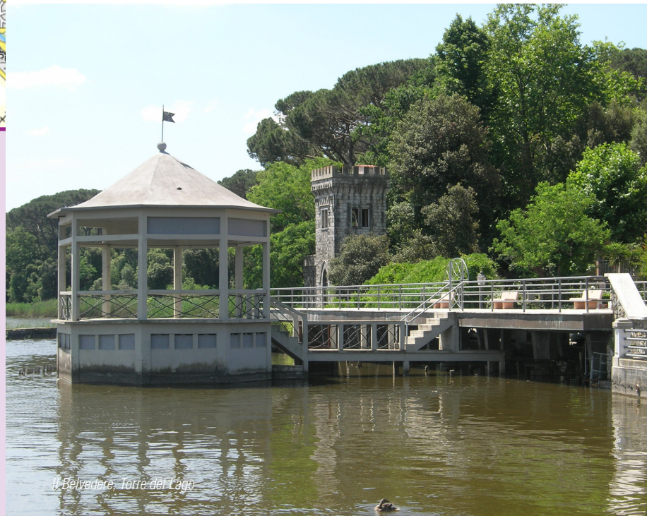
Il Belfvedere, Torre del Lago